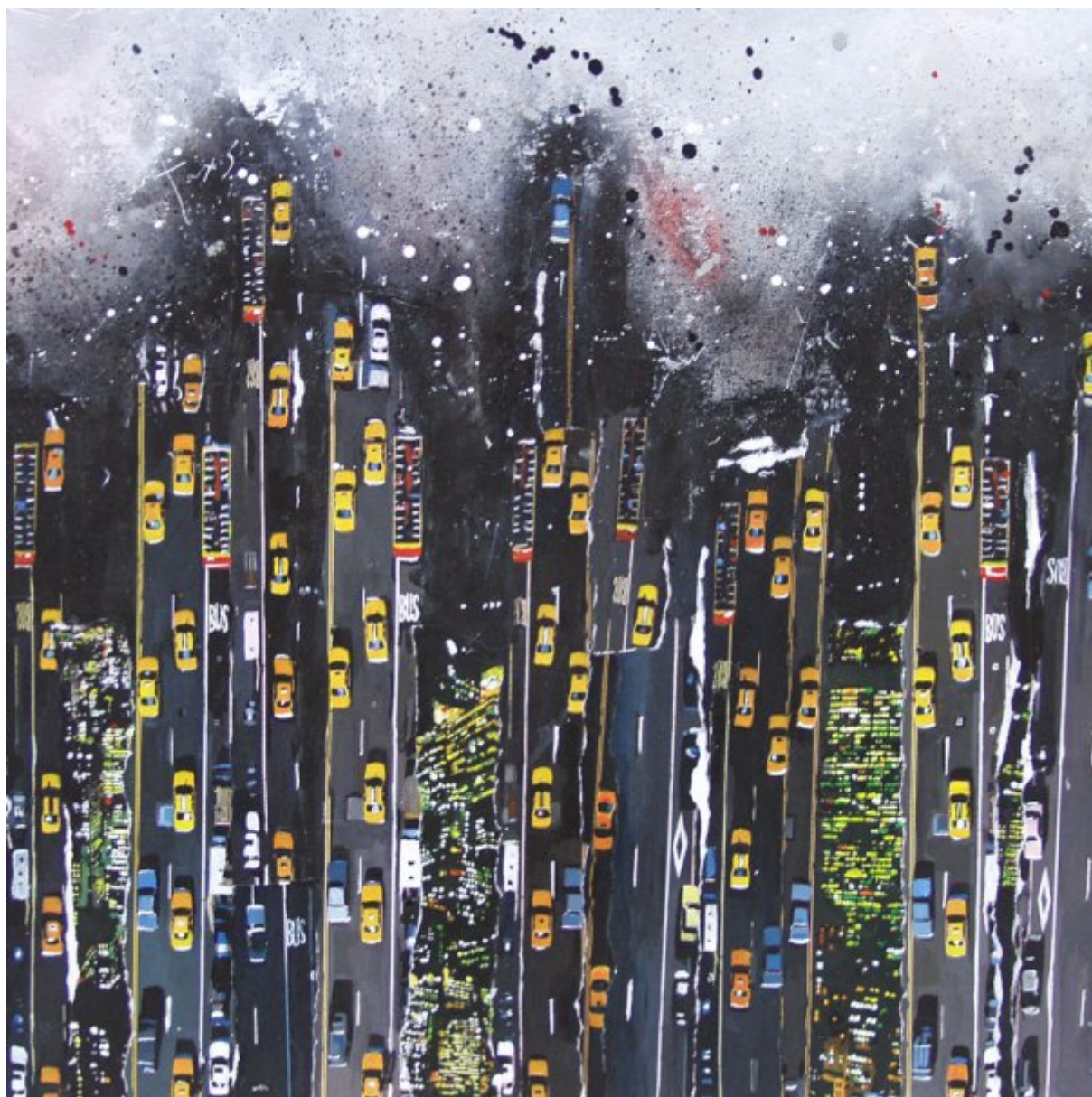
Taxis Acrylique, collages et encre 50x50cm