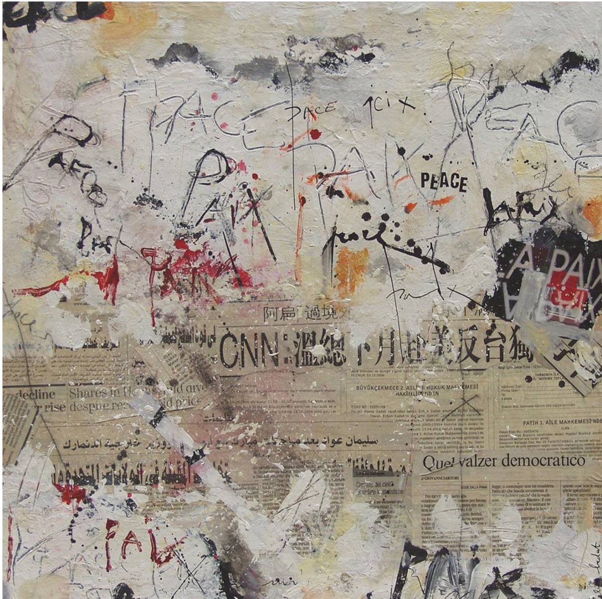
Paix Technique mixte 50x50 cm