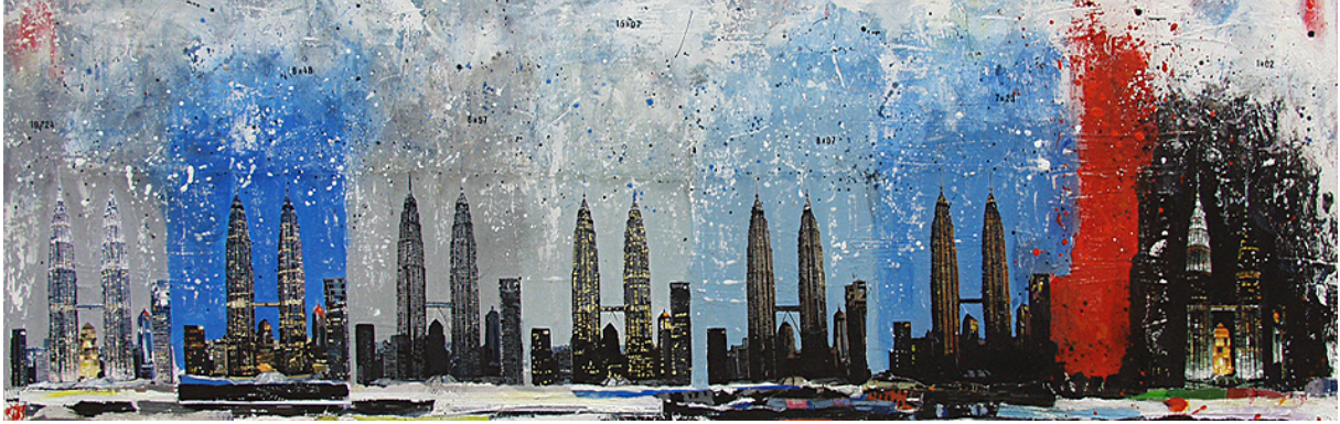
La course du temps Acrylique, collages et encre 50x150 cm