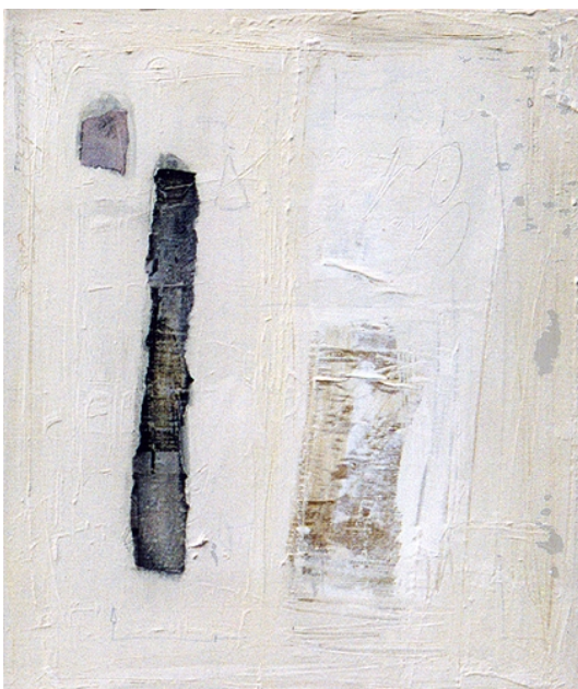
Fenêtre sur cour 3 Acrylique, collages 27x43 cm