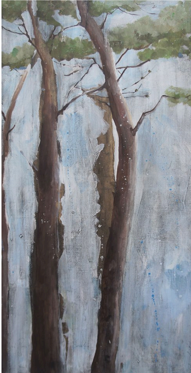
Les pins de Coralie 1 Acrylique, collages et encre 120x60 cm