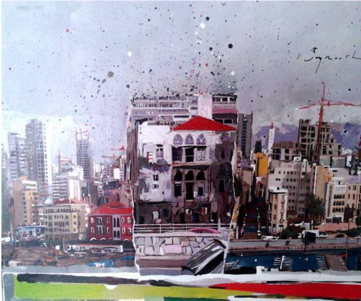
« Beyrouth » vue par l'artiste.