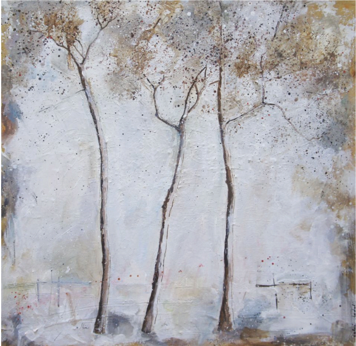
A l'orée Acrylique, collages et encre 60x60 cm