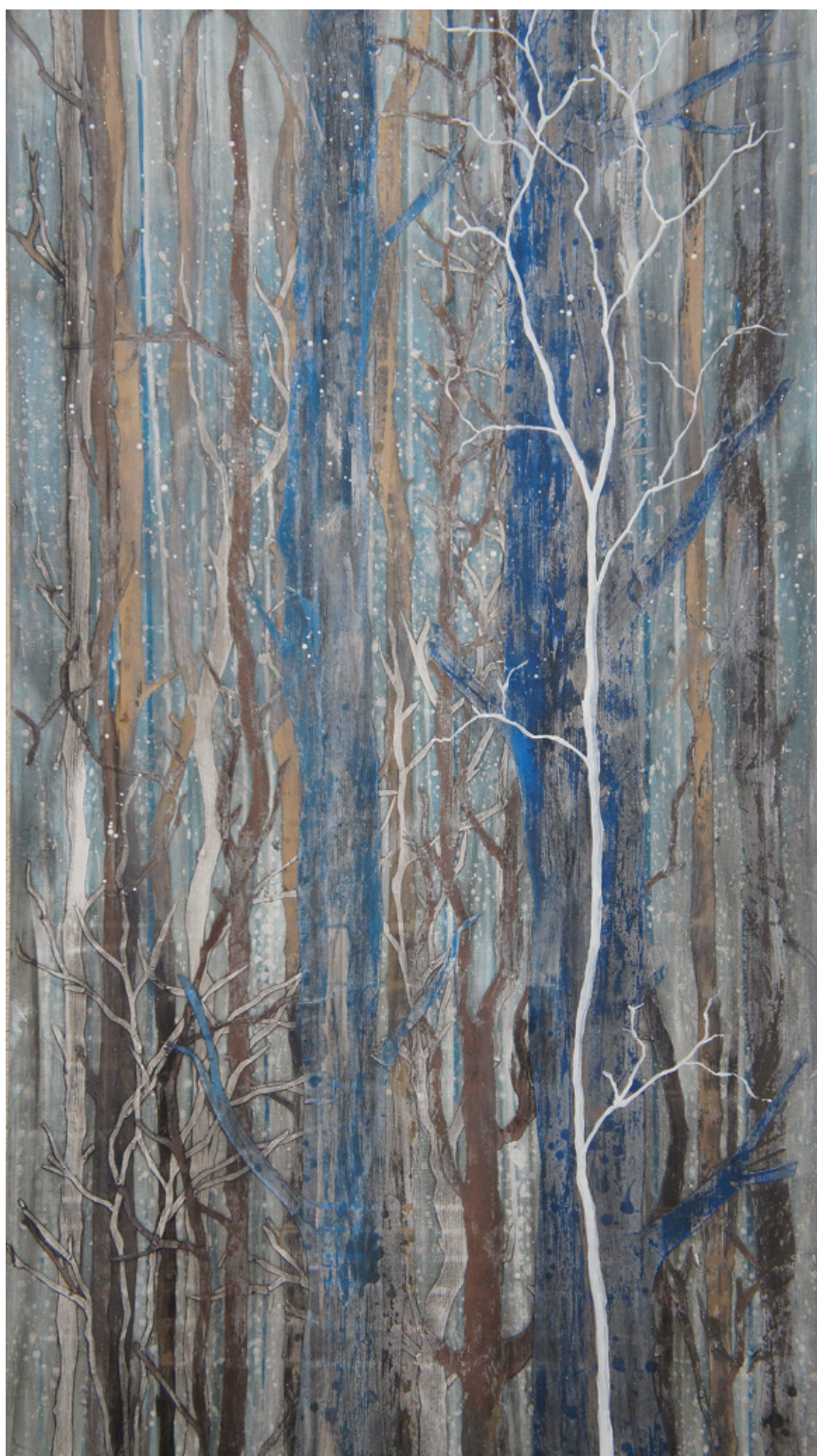
Arbre Blanc Acrylique, collages et encre 120x160 cm