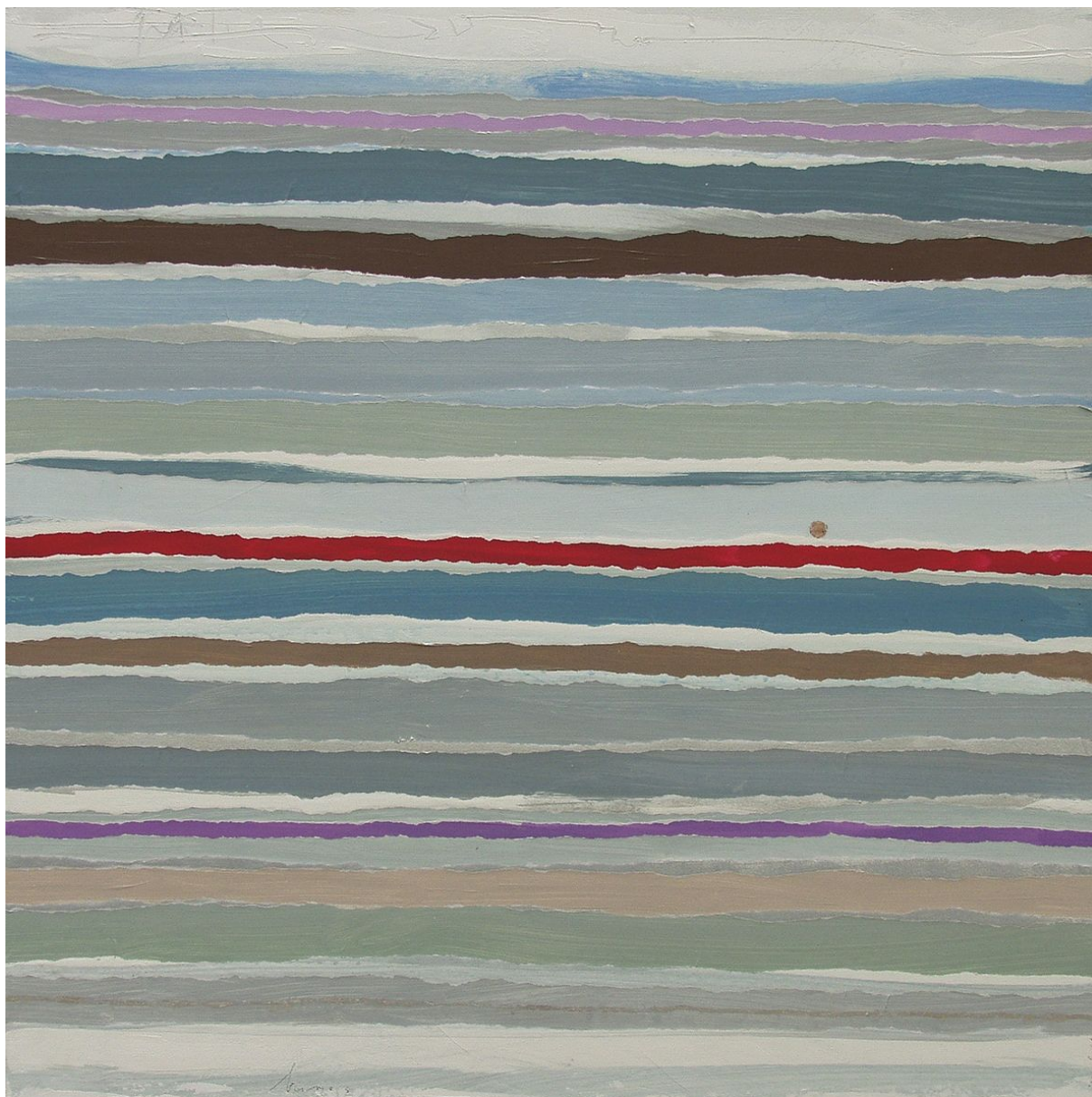
Horizons Acrylique 100 x 100 cm