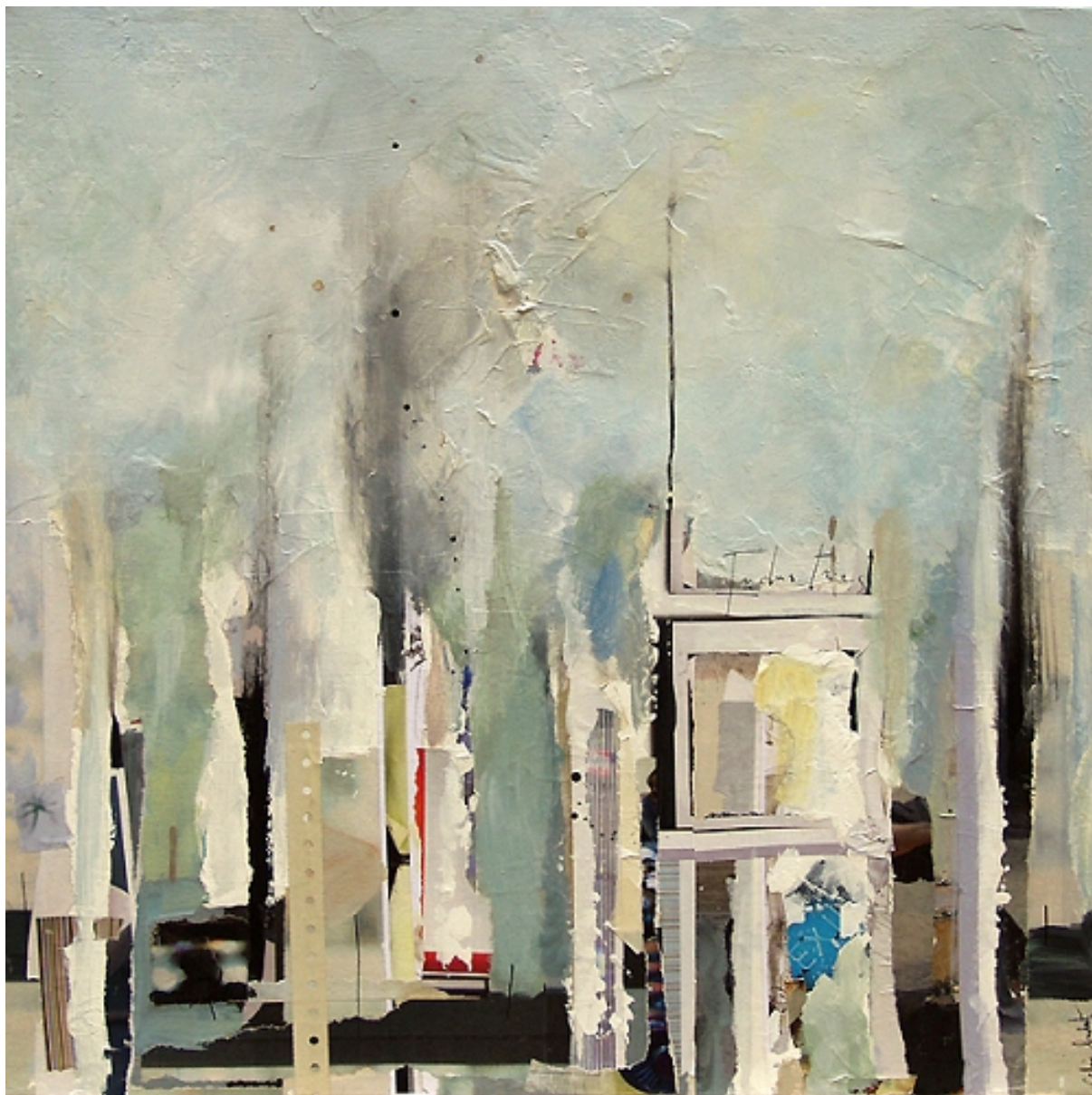
Industries Acrylique, collages et encre 50 x 50 cm