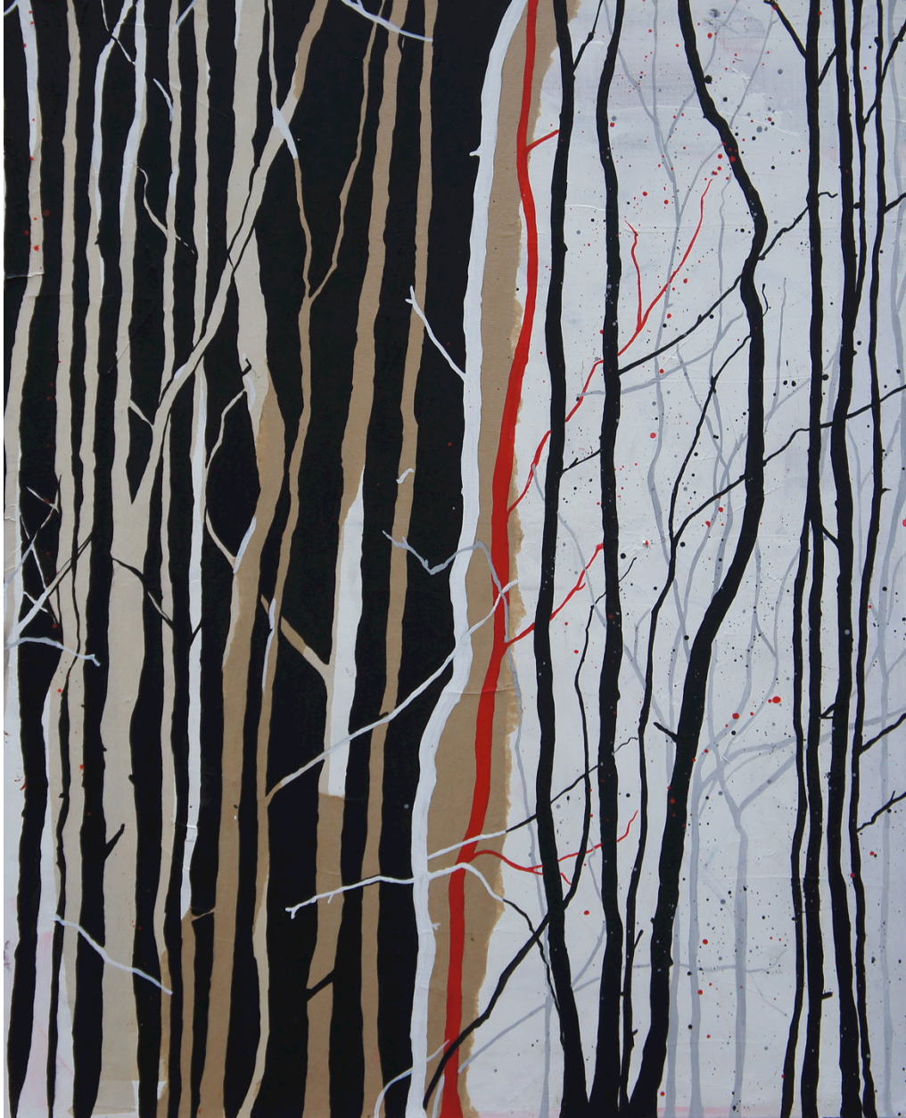
Arbre rouge 1 Acrylique, collages et encre 100x81 cm