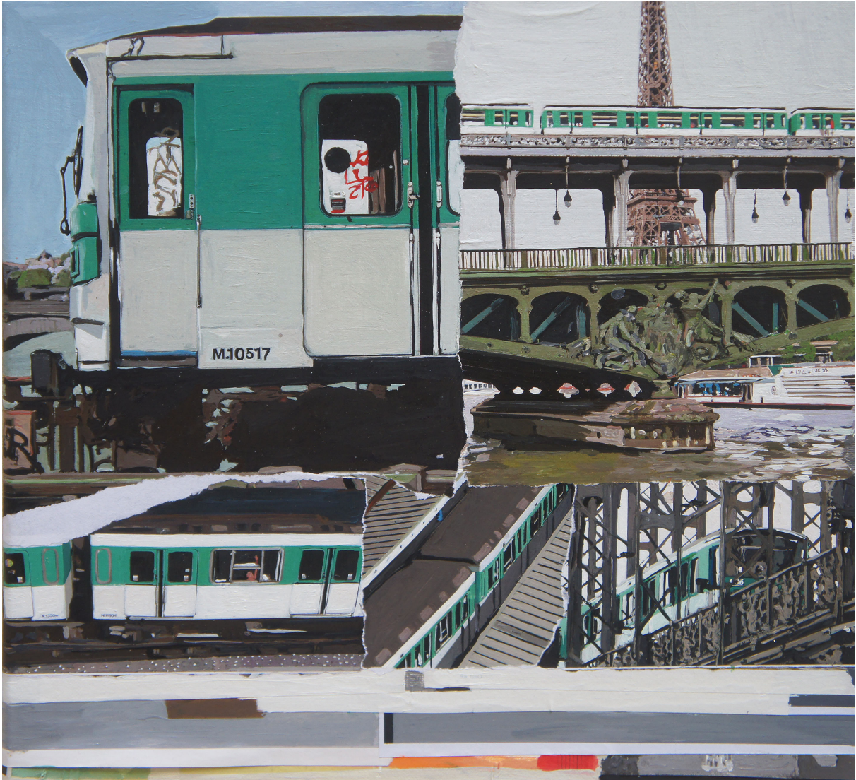
Paris en métro Acrylique, collages et encre 40x40 cm