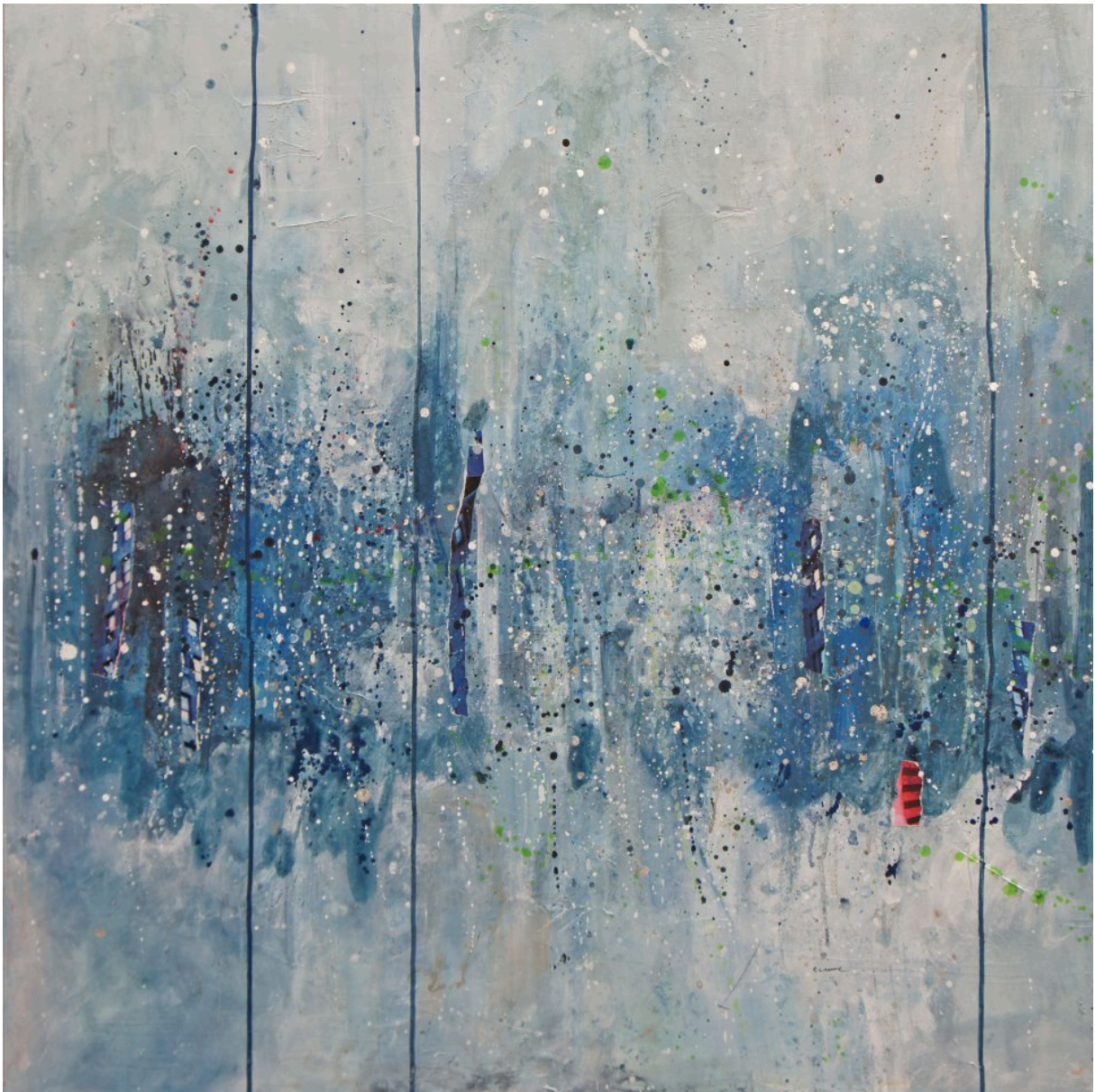
L'écume Acrylique, collages et encre 100x100 cm