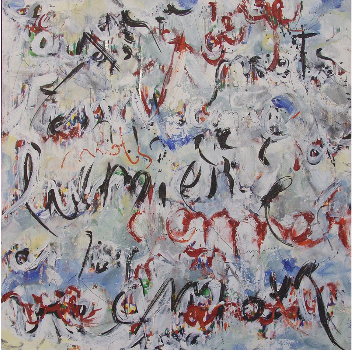
Lumière Technique mixte 100x100 cm