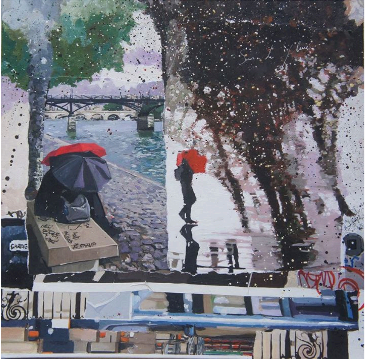
Paris sous la pluie Acrylique, collages et encre 435x35 cm